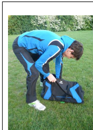
Sweatshirt à capuche

Notre nouvel équipement club ERIMA, distribué par IPPON.SPORT, est choisi pour la prochaine olympiade : vous achetez à l'unité ou dans le cadre d'un « pack » ; vous trouverez tous les tarifs selon les cas au verso. Essais possibles au club, IPPON.SPORT nous fournira plusieurs tailles.