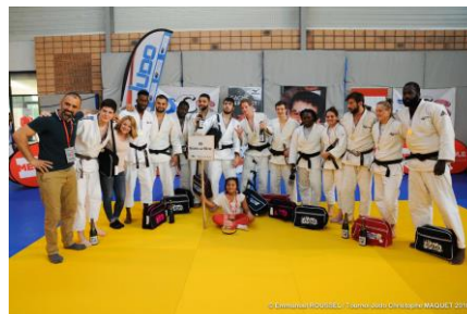
AS Bourg La Reine, vainqueurs en 2018