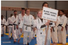
Blanc Mesnil Sport Judo, vainqueurs en 2017

27/01/20 VERSION LABEL EXCELLENCE 2020 !