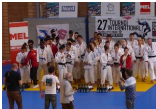
FLAM91, vainqueurs en 2013, 2014, 2015 et 2019