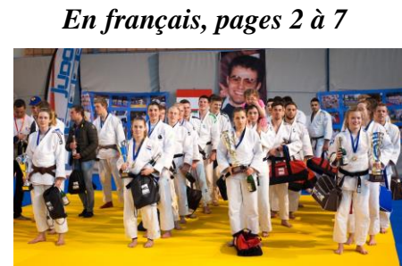
JTS Heerenveen (NED), vainqueurs en 2016