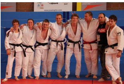
Westland Kodokan (NED), vainqueurs en 2011