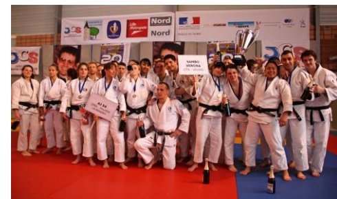
Sambo Verona (ITA), vainqueurs en 2012