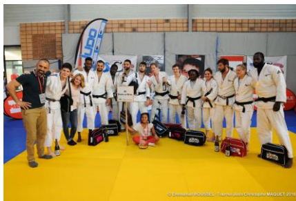
AS Bourg La Reine, vainqueurs en 2018