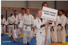
Blanc Mesnil Sport Judo, vainqueurs en 2017