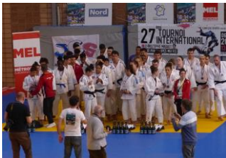
FLAM91, vainqueurs en 2013, 2014, 2015 et 2019