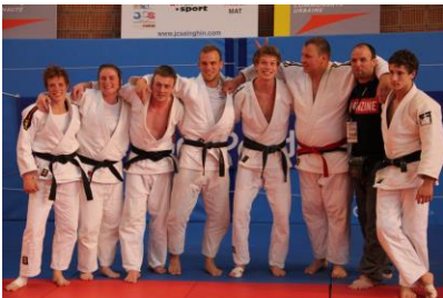
Westland Kodokan (NED), vainqueurs en 2011