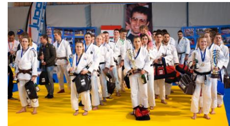
JTS Heerenveen (NED), vainqueurs en 2016